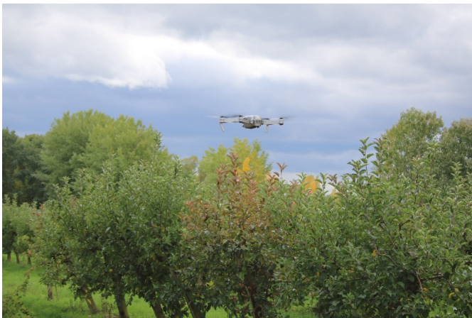
Abb. 2 Mit einer Drohne verschaffen sich die Wissenschaftler einen Überblick über die gesamte Obstanlage. Zukünftig sollen die Krankheitssymptome direkt anhand der spektralen Signatur aus Drohnen- oder Satellitenbildern ermittelt werden.