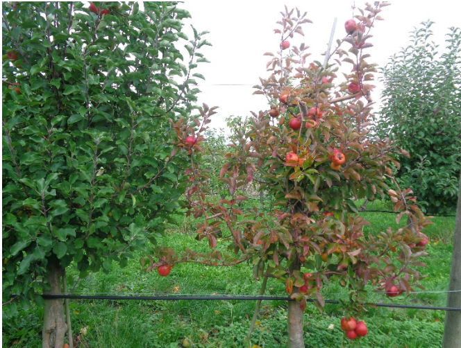
Abb. 1 Mit Apfeltriebsucht infizierter Baum, der die Symptome Rotlaubigkeit und Kleinfrüchtigkeit zeigt.